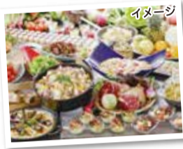
里山のランチバイキング

秋風にそよぐ、約800万本の色とりどりのコスモスが咲く、関西最大級の「亀岡 夢コスモス園」にご案内します。続いて、ここ懐かしい、里山にある烟河(けぶりかわ)で、ご昼食を隣接の自家農園で収穫したみずみずしく、味わい深い、旬の京野菜をふんだんに使った里山料理が大人気!オープンキッチンで作られる、できたて、熱々のメインディッシュほか、60種の多彩な料理を好きなだけお召し上がりください。午後は、保津川を縫うように走る、レトロな旅