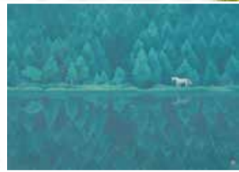
東山魁夷(緑響く) 1982年長野県信濃美術館 東山魁夷館蔵