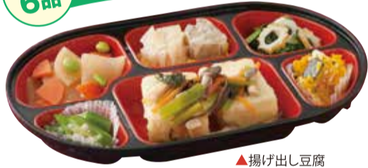
▲揚げ出し豆腐 お弁当サイズ:ヨコ280mm×タテ173mm