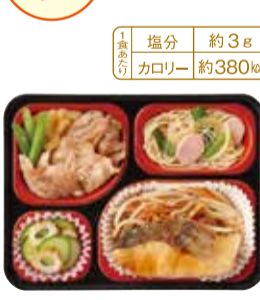
▲アジの煮付け お弁当サイズ:ヨコ210mm×タテ160mm