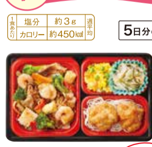
▲海鮮炒め お弁当サイズ:ヨコ242mm×タテ148mm