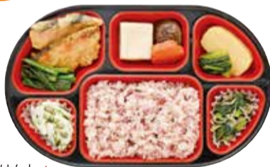
梅ごはん ▲ 鮭揚げびたし お弁当サイズ:ヨコ280mm×タテ173mm