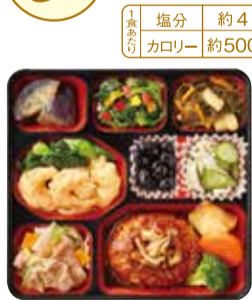
▲ハンバーグ きのこ入りデミソース お弁当サイズ:ヨコ207mm×タテ207mm