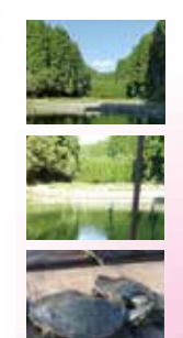
熊本県 高級ブランド種の「肥後日の元すっぽん」100%使用

さらに今なら、うれしいニュース! この良質すっぽんを、なんと78% OFFの630円! 手ごろな値段で毎日続けられるチャンス! これまでのダイエットでは満足できなかったなら、ぜひ栄養豊富なダイエットサポートサプリ「肥後すっぽんもろみ」をあなたも今すぐご実感ください!