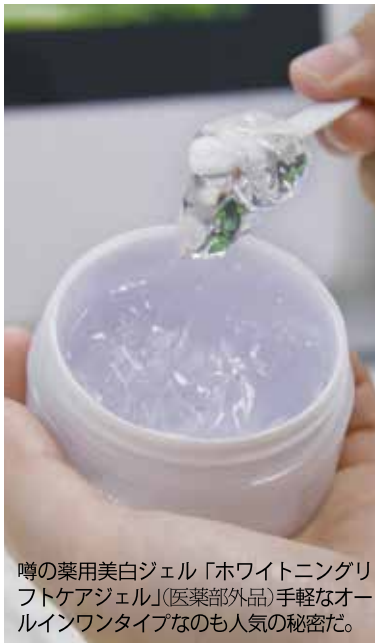
噂の薬用美白ジェル「ホワイトニングリフトケアジェル」(医薬部外品)手軽なオールインワンタイプなのも人気の秘密だ。

それが、参観日の前日に6歳の娘に「ママ、明日はお顔のテンテンを消してきてね！」って言われちゃって…。シヨックでした。ええ。「ああ、こんな小さい子にも私の顔って汚くみえるんだ」って。