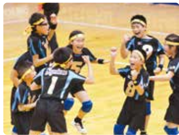
「やった!!」思わずガッツポーズ

ナ(枚方市菊丘南町)で開催され、枚方市内のドッジボールチーム「菅原ダイナマイトハリケーン」の強さではなく、今年のチームは、頭脳プレーが持ち味。ドッジボールは5分間の限られた時間内で、攻守がめまぐるしく入れ替わる激しいスポーツと