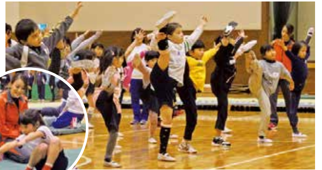
「頑張ってる!」と田中理恵さんの声援を受けて

立春は過ぎてても寒さの厳しい2月8日、枚方市立総合体育館でロンドン五輪日本代表の田中理恵さんとアトランタ五輪日本代表の田中光さんを講師に迎え、ジュニア器械体操教室が