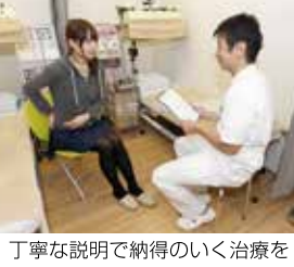
丁寧な説明で納得のいく治療を

方々に喜ばれています。同業の人も不良時には駆け込んでくる同僚。決してあきらめないでご相談されてはいかがでしょうか。