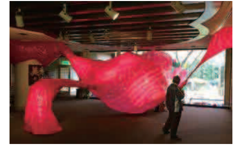
「御殿山によきによき展」

まちかど空間に現代アートを“によき”っと！現在と歴史あるひらかたまちかど空間が交差するアートへ導く作品をめざします。