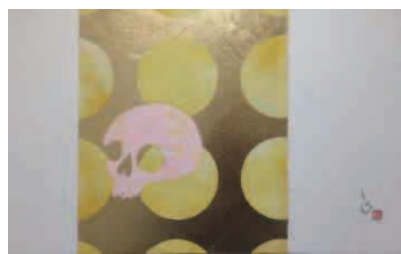
「私のおばあちゃん」